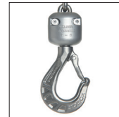
Gancio bozzello di acciaio inossidabile Stainless steel bottom hook