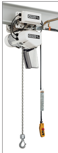
Verniciatura epossidica bianca White epoxy paint