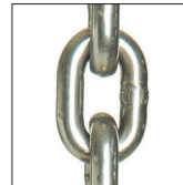
Catena di carico nickel plated Nickel plated load chain