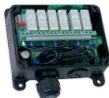
Ricevitore programmabile End-User con funzioni Master-Slave e Take-Release End-User programmable receiver with Master-Slave and Take-Release functions