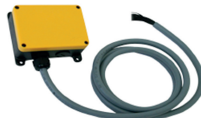
Ricevitore fornito standard precablato Pre-wired standard receiver