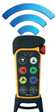
Frequenza libera Wi-Fi 2,4 GHz Free Wi-Fi 2.4 GHz frequency